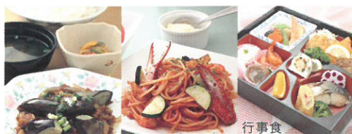
和・洋・中バランスの取れた様々なメニュー 行事食

当施設の管理栄養士がご入居者さまの状態に合わせてメニューを作成。糖尿病の方でも安心して食べられる食事サービスです。