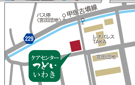
「ケアタウンつどい いわき」施設内