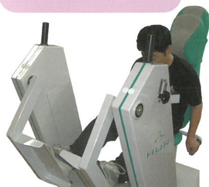
高齢者専用のパワーリハマシン