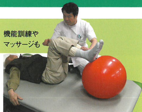
機能訓練や マッサージも