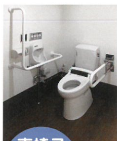
車椅子対応トイレ