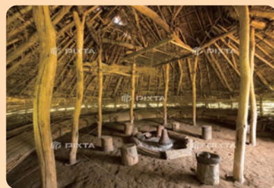
敷地内に復元された竪穴式住居

また地域に根ざした介護の表れとして、施設名称は開設にあたってご協力いただいたその土地のオーナーさまのお名前を名付けております。