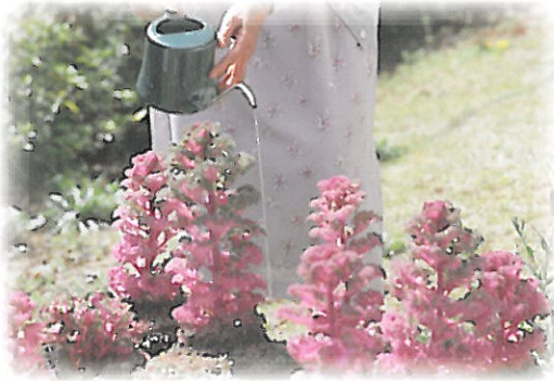
花・野菜づくり 大地と触れあい、花や野菜を育てることにより、こころを豊かにし、収穫した野菜を食卓に並べることで育てる喜びを得、イキイキとお過ごしいただけます。