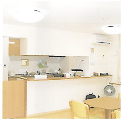
食事で五感を 刺激するキッチン 会話も弾む対面キッチンで、料理の香りや音など、五感を刺激する工夫がなされています。