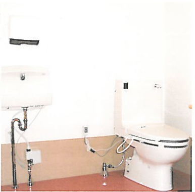
車椅子にも配慮した バリアフリー設計 トイレや廊下など施設内はすべて車椅子での移動がしやすいよう配慮。段差がないので、どなたでも安心してご利用いただけます。