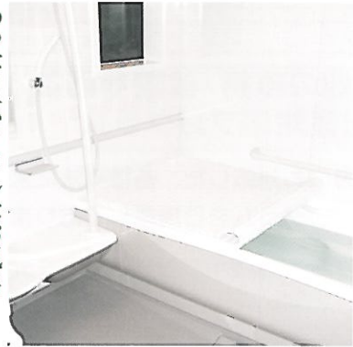
ゆったり広々としたお風呂 ゆったりと足を伸ばせる広さ、ヒートショックを防ぐヒーター、手すりの位置などにも配慮した安全性の高いお風呂です。もちろん、介助入浴も行っています。