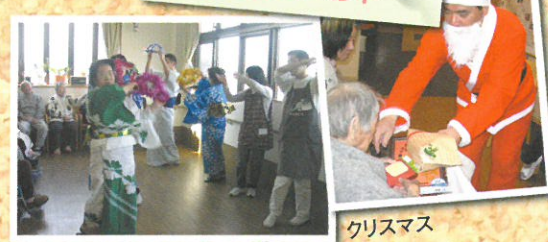
四季を感じる行事やイベント