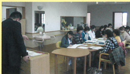
高い専門性を養う社内研修会