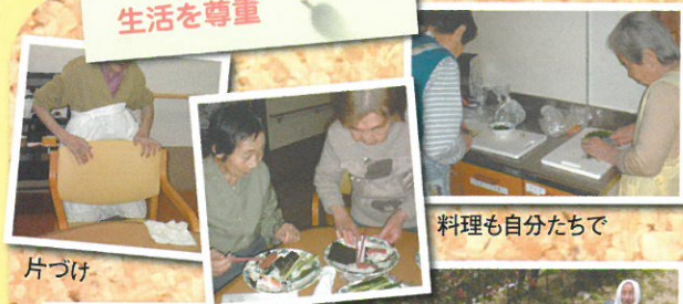
これまでの生活を尊重

少しでも長く、今の生活を続けていただけるように。ベッドからの起き上がりや腰やひざに負担のかからない姿勢の訓練、嚥下をスムーズにする体操など、機能の維持に努めています。