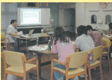
医師による学習会

提携医療機関との連携による信頼の医療体制に加え、ご入居者さまの体調の変化に早く気づくことができるよう、毎日の健康管理も徹底。各居室はナースコール対応のため、体調がすぐれないときもすぐに専門スタッフが駆け付けます。