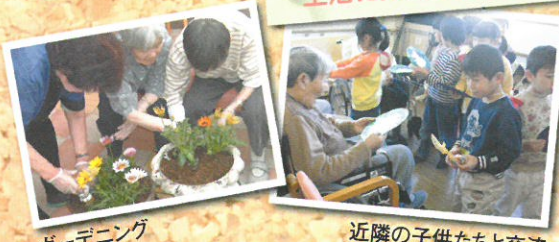
ときには変化を加えて、生活に楽しみと潤いを