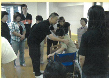
理学療法士による介助指導

グループホーム つどいでは、専門スタッフがご入居者さまお一人おひとりの生活を尊重しながら、自立した生活をサポート。安全面や健康管理はもちろん、ご入居者さまの「その方らしい暮らし」を、目配り、気配り、心配りで24時間見守ります。