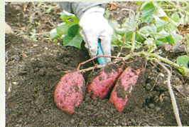
南大塚は「さつま芋掘り」ができる農園もあります。