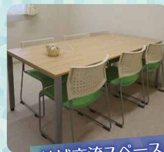
地域交流スペース・相談室

居室は全てプライベートが守られた個室。各部屋にはナースコールが設置され、体調がすぐれないときには専門スタッフがすぐに駆けつける体制です。