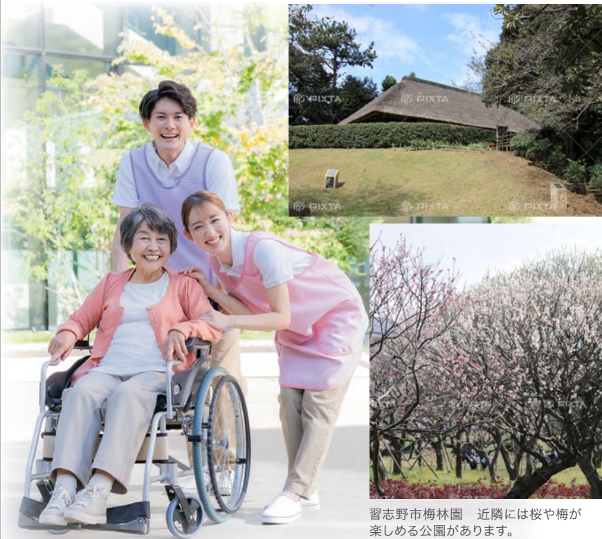
習志野市梅林園 近隣には桜や梅が楽しめる公園があります。

近隣の藤崎森林公園内 旧大沢家住宅(千葉県指定有形文化財) 寛文4年(1664年)に建てられた、築350年以上の邸宅。