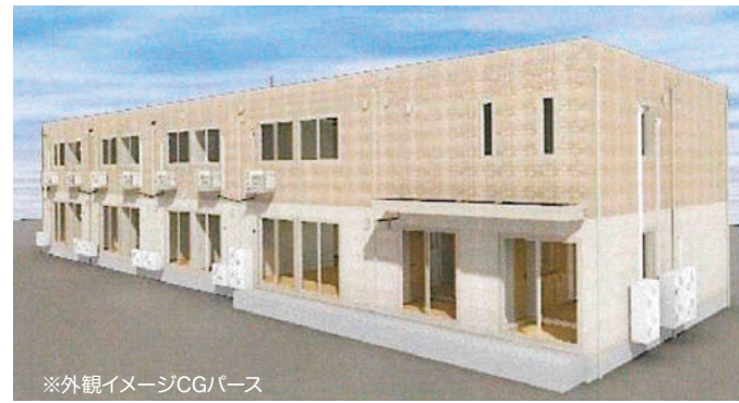
※外観イメージCGバース

■類型/グループホーム ■物件の所在地/千葉県習志野市本大久保2-9-16 ■入居開始/2023年3月1日~ ■入居資格/習志野市在住の要支援2以上でおおむね自立した日常を送れる方、認知症と認められた方 ■居室面積/11.26㎡、11.38㎡ ■構造・規模/鉄骨造2階建 ■建築面積/278.39㎡(84.21坪) ■延床面積/551.02㎡(166.68坪) ■敷地面積/870.30㎡(263.26坪) ■土地・建物の権利形態/賃借 ■居室数および居室区分/1ユニット9室×2ユニット、計18室(全室個室) ■駐車スペース/8台(障がい者用1台含む) ■交通/京成本線「京成大久保」駅徒歩5分(約350m) ■居住の権利形態/利用権方式 ■居室設備/洗面、収納、エアコン、電動ベッド、TVジャック ■共用設備/リビングダイニング、台所、浴室、洗濯室、共用トイレ、他