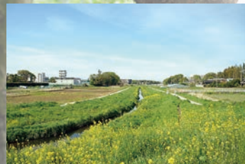
古和釜橋から見た 近隣を流れる木戸川の風景