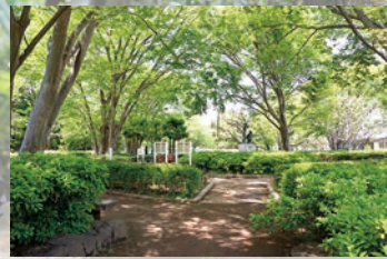
北習志野近隣公園