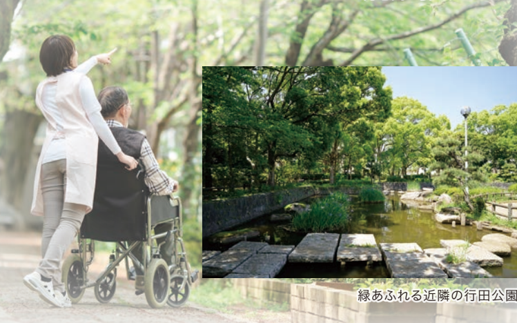
緑あふれる近隣の行田公園