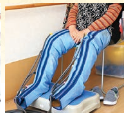
エアマッサージ器(メドマー)