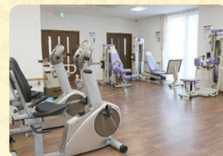
Senoh cordless bike 67i