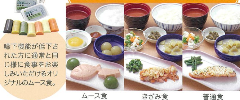
ムース食 きざみ食 普通食