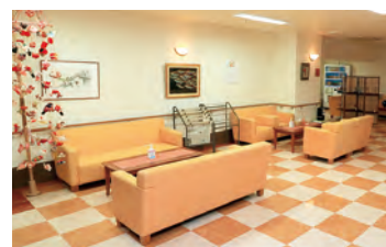
▲面会にも使える1Fホール