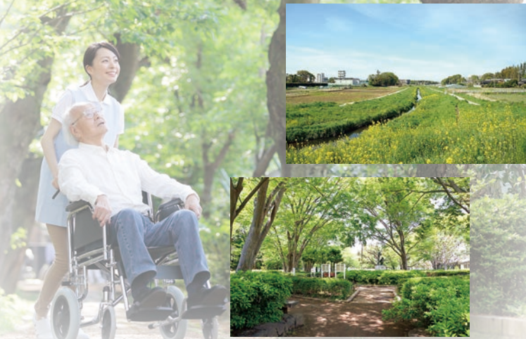
北習志野近隣公園