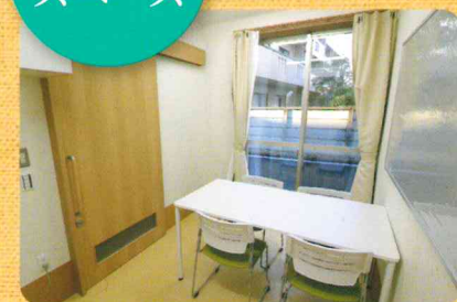
1階の地域交流スペース